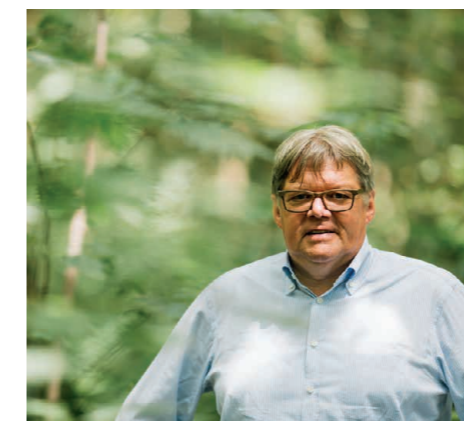
Ludwig Vandenhove gedeputeerde van Leefmilieu en Natuur