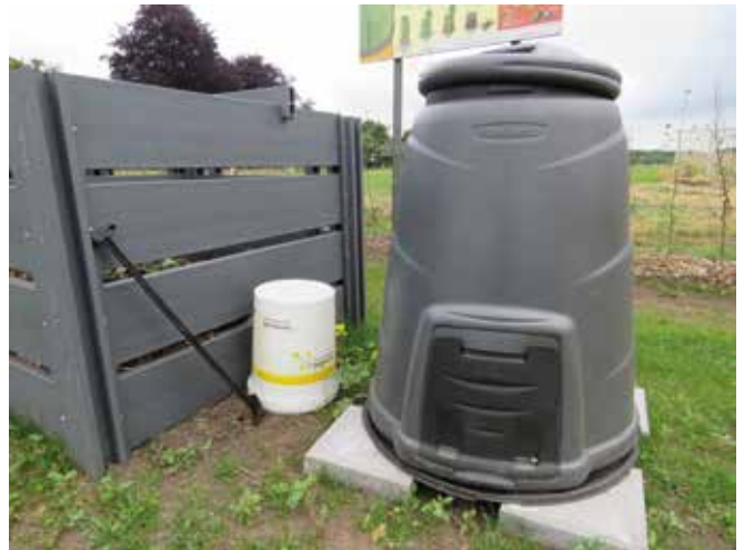
Tabel 12: compostering

De ene samentuin waar het antwoord 'anders' luidt, is een samentuin waar de gemeente het groenafval ophaalt en op een andere locatie voor de samentuin composteert.